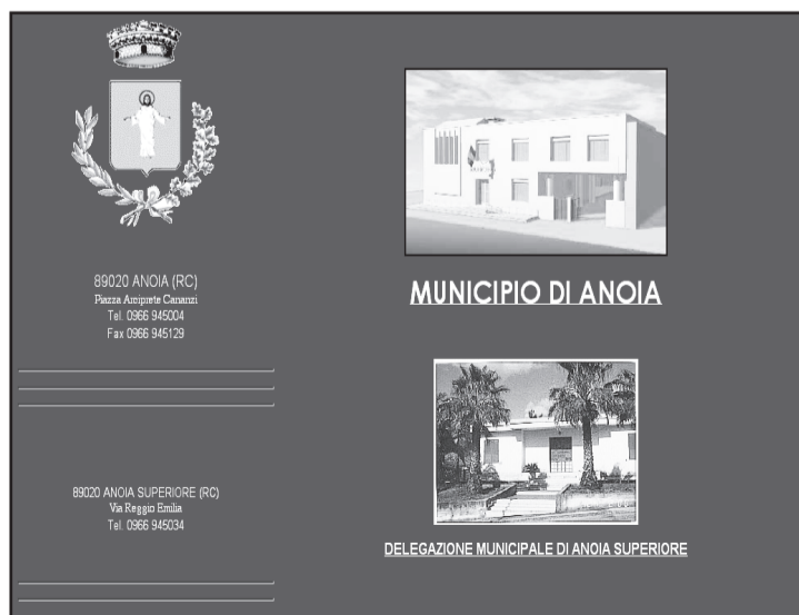
Vista de la pàgina web del Comune di Anoia (ajuntament)

Un exemple és el Codex Purpureus, excepcional llibre litúrgic grec del segle VI conservat en el Museu Diocesà de Rossano, escrit amb lletres platejades i il·lustrat amb esplèndides i elegantíssimes figures i escenes religioses. L'espectacular costa de Tropea sobre el mar Tírrè representa una sorpresa impressionant per a qui la veu per primera vegada. I això que Calàbria està banyada també pel mar Jònic. Sobta trobar-hi, gairebé mig amagada, una altra Anoia.